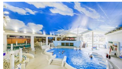
-箱根小涌園ユネッサン(神々のエーゲ海)-